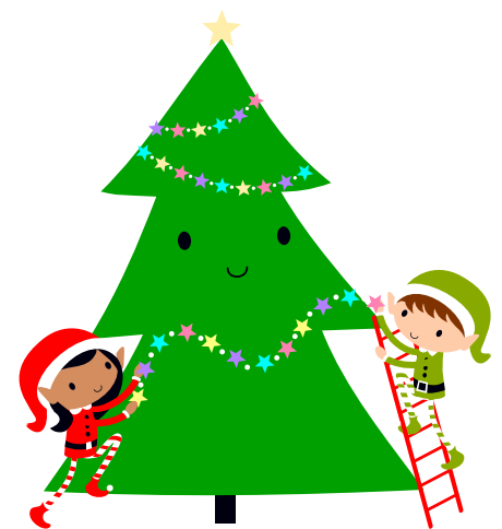
Arbre de Noël des enfants 2025