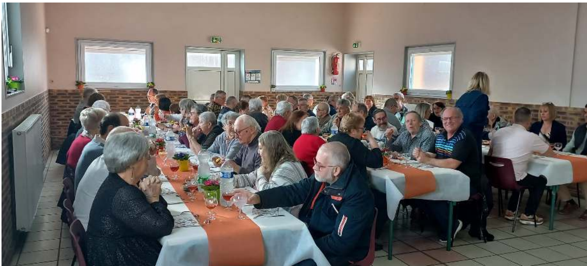
Repas des aînés février 2026