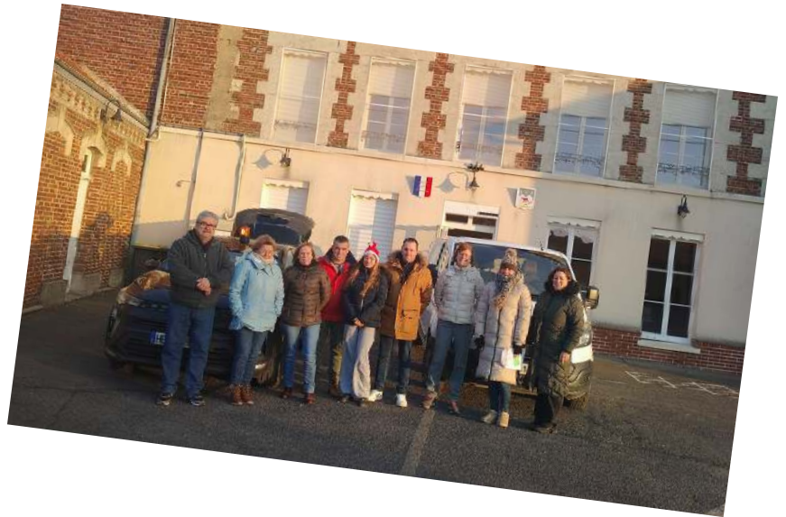
Distribution du colis des aînés 2025