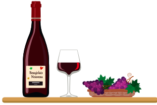
Soirée Beaujolais 2025