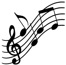
Concert du groupe mérysiens "Les absents" janvier 2026