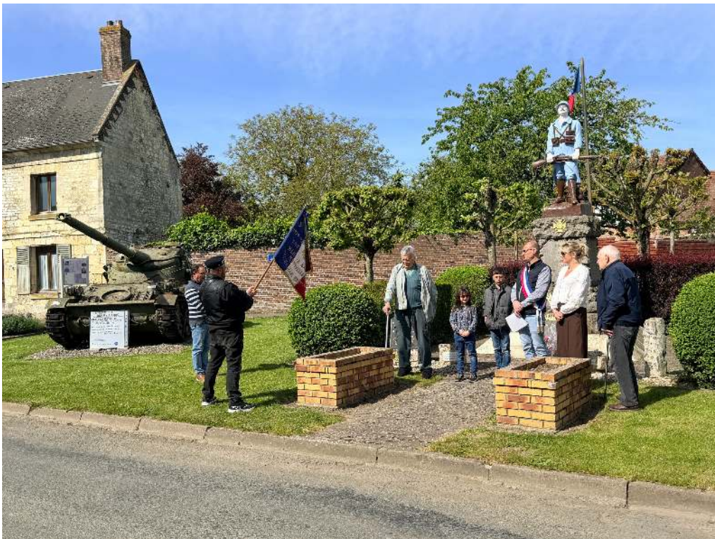
Cérémonie des déportés du 26 avril 2026