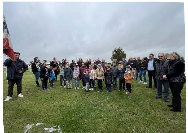
Cérémonie du 11 novembre 2025